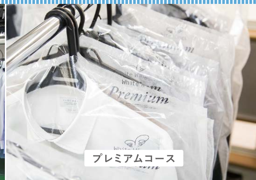
プレミアムコース